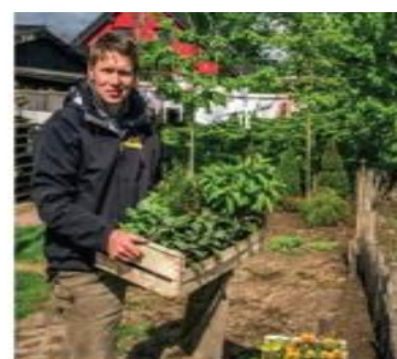
Erbsen und Bohnen sind Tagetes schätzen ihr Gemüse vor Schädlingen.

Dieses Wissen ist Gold wert für Hobbygärtner, denn es verbessert die Erträge und spart Chemie.